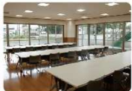
地域交流スペース