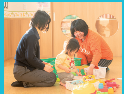
院内保育園「つぼみ保育園」